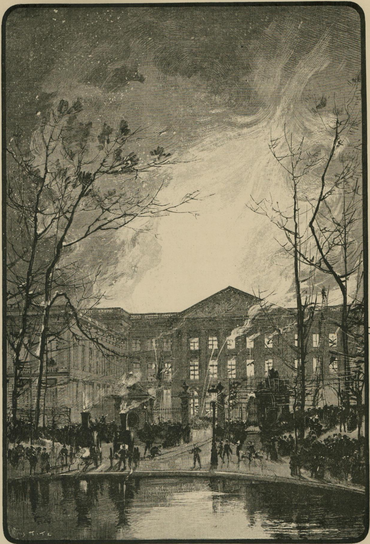
L'INCENDIE DE LA CHAMBRE DES REPRESENTANTS DANS LA SOIRÉE DU 6 DÉCEMBRE 1883 — Dessin de L. Titz.